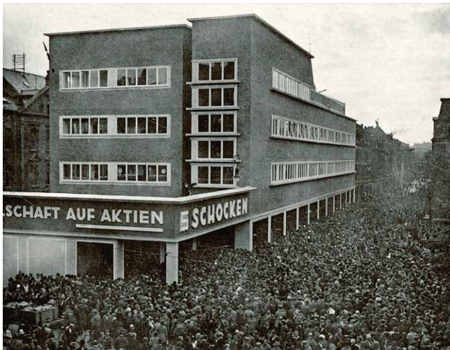
Eine Menschenmenge versammelt sich zur Eröffnung des Kaufhauses Schocken in Nürnberg am 11. Oktober 1926.

Nachdem die Ad hoc-Arbeitsgruppe (AG) „Judentum in Bayern in Geschichte und Gegenwart“ im Oktober 2021 ihre Arbeit aufnahm, gab es schon früh Ideen zur Erstellung einer interaktiven Online-Karte. Wie alle geplanten Vorhaben der AG – darunter Podiumsdiskussionen, Vorträge, eine Podcastreihe sowie eine Tagung – soll auch die Karte nicht nur ein Fachpublikum, sondern eine breite Öffentlichkeit erreichen. So entstand die Idee, über eine Website einen Eindruck von der vielfältigen und jahrhundertelangen jüdischen Vergangenheit zahlreicher bayerischer Orte zu vermitteln, andererseits aber auch jüdisches Leben in der heutigen Zeit abzubilden.