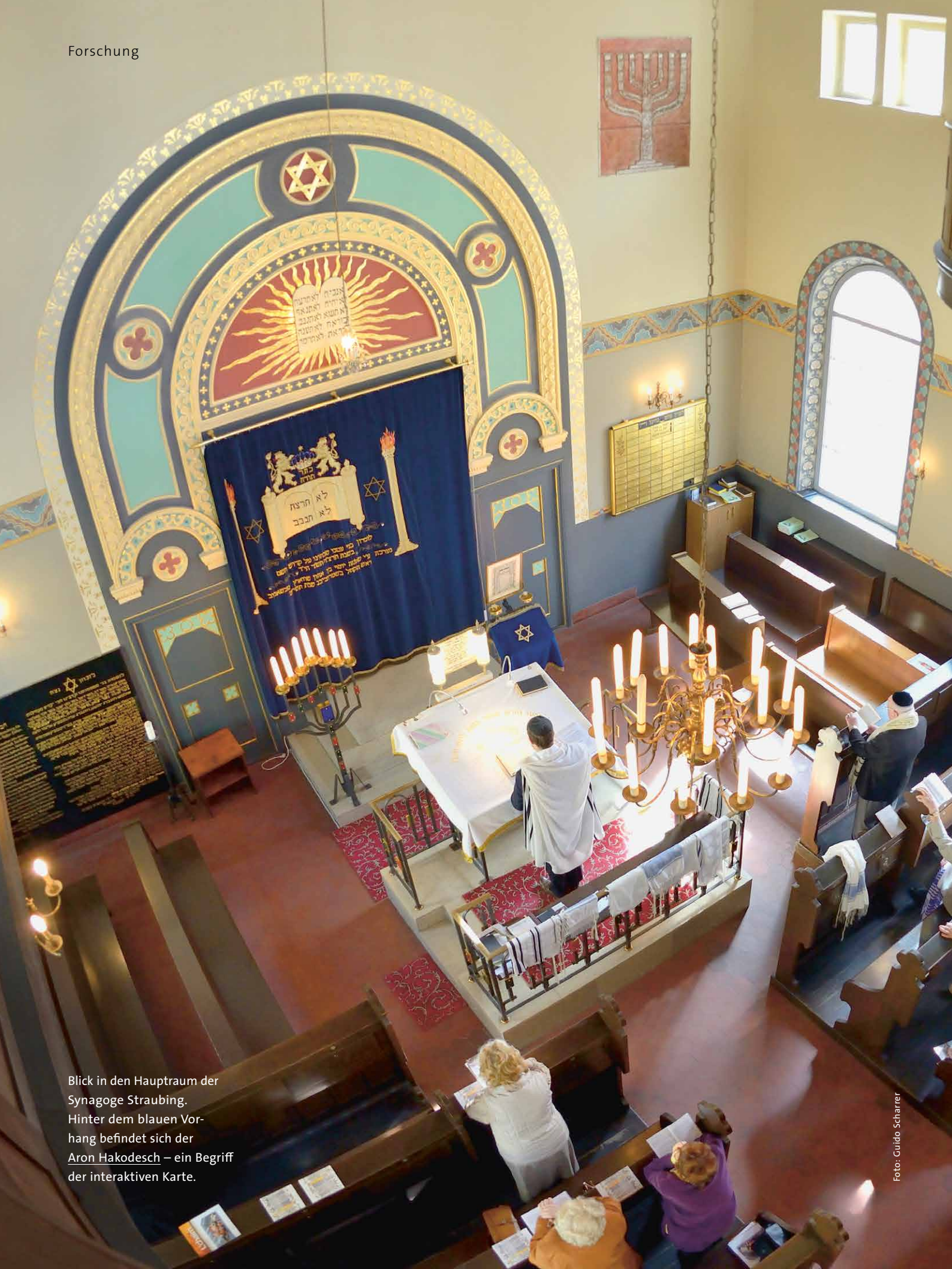
Blick in den Hauptraum der Synagoge Straubing. Hinter dem blauen Vorhang befindet sich der Aron Hakodesch – ein Begriff der interaktiven Karte.