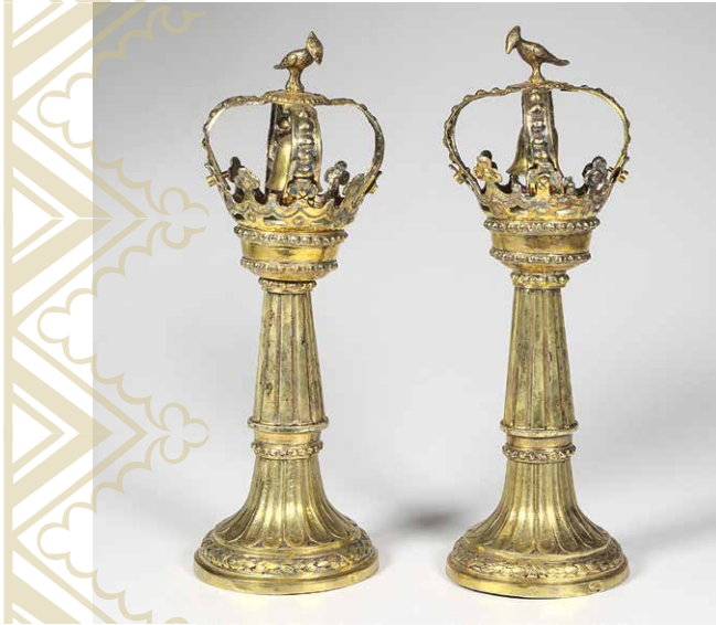
Kunstvoll verzierte Rimonim werden im Jüdischen Museum Augsburg ausgestellt. Sie dienen als Toraschmuck.